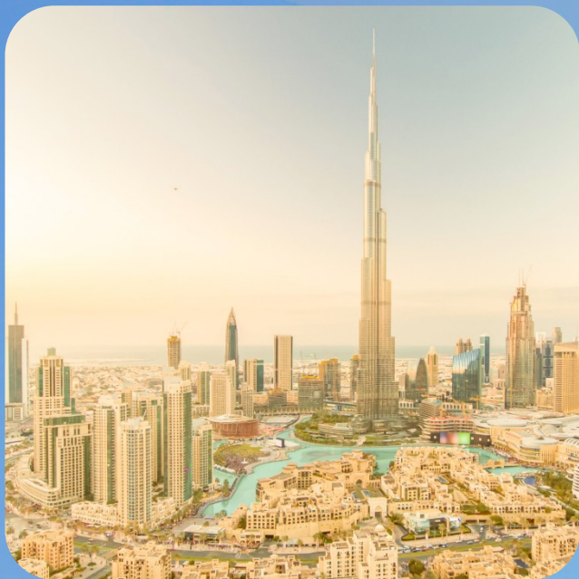
DUBAI CITY + BURJ KHALIFA