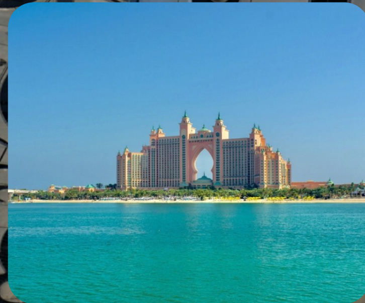
AQUAVENTURE WATER PARK