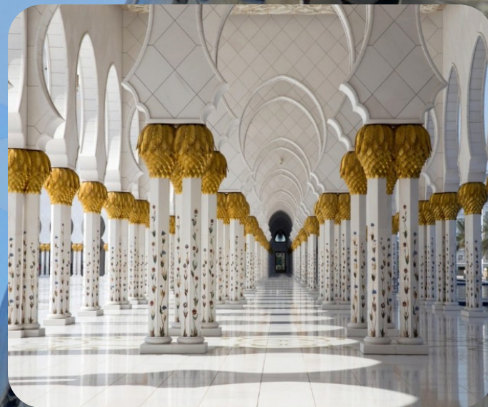
ABU DHABI PREMIUM